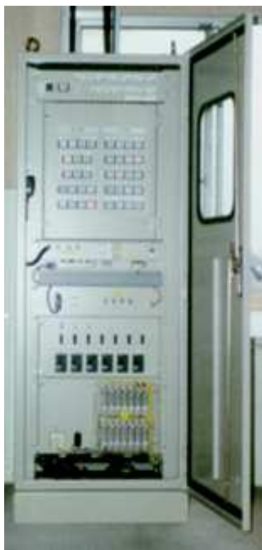
ダム・発電放流警報装置