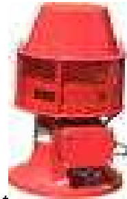
一般用モータサイレン