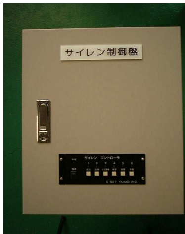
モータサイレン用制御盤