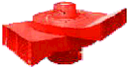
河川用モータサイレン