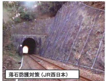
落石防護対策 (JR西日本)