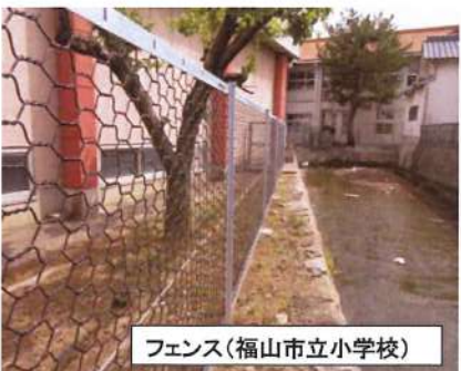
フェンス (福山市立小学校)