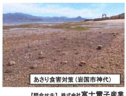
あさり食害対策 (岩国市神代)

【問合せ先】 株式会社富士電子産業 TEL(082)283-3123(代) 〒734-0022 広島市南区東雲1丁目14-24