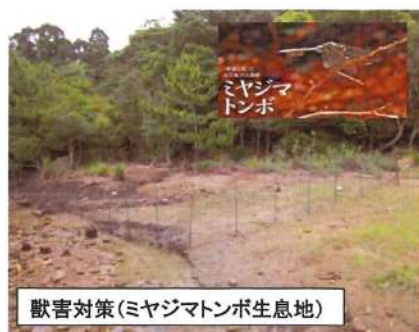
獣害対策 (ミヤジマトンボ生息地)