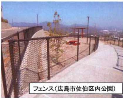
フェンス (広島市佐伯区内公園)