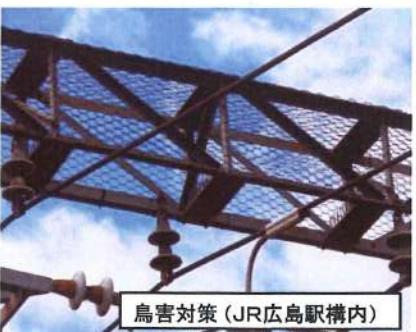
鳥害対策 (JR広島駅構内)