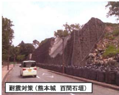
耐震対策 (熊本城 百間石垣)