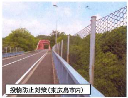
投物防止対策 (東広島市内)